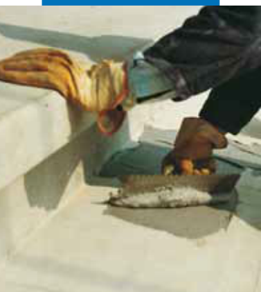
Aplikácia Adesilex PG1 zubovou stierkou pre konštrukčné lepenie prefabrikovaných schodov