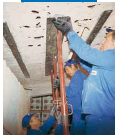
Inštalácia kovovej platne pre zosilnenie konštrukcie