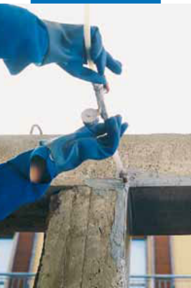
Stĺp opláštený s Adesilex PG1