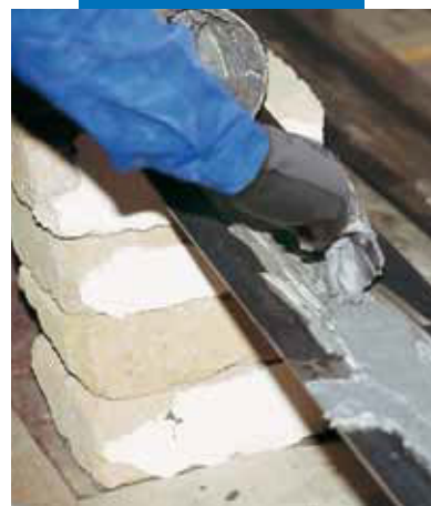
Aplikácia Adesilex PG1 na kovovej platni