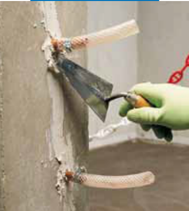
Upevnenie injektážnych trubic