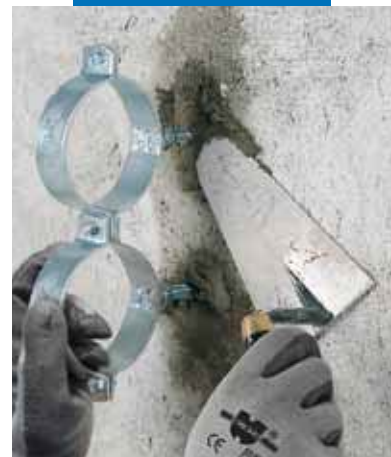
Lampocem použitý pri osadzovaní konzol pre rúry