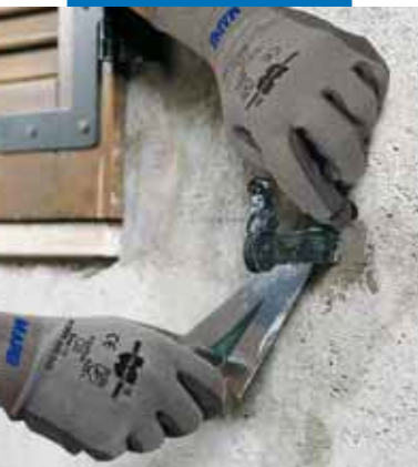
Lampocem použitý pri osadzovaní okenného kotviaceho prvku