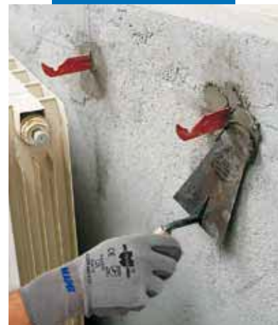
Lampocem použitý pri osadzovaní radiátora