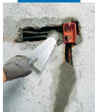
Lampocem použitý upevňovaní puzdra a elektrických káblov