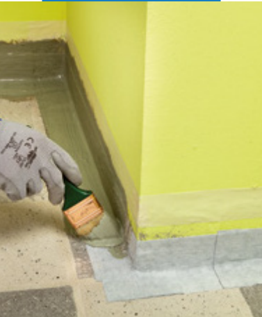
Aplikácia Mapeband SA na poter