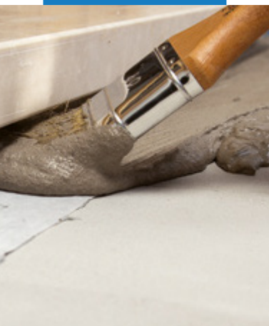
Príklad aplikácie Mapeband SA v ťažko prístupnom mieste pod dverným prahom