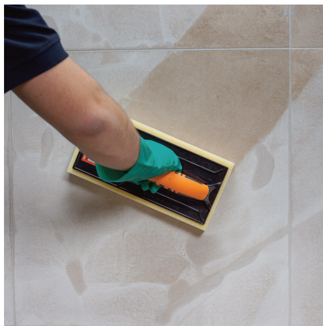
...a ľahké a príjemné umývanie povrchu, bez vymývania škárovacej hmoty.