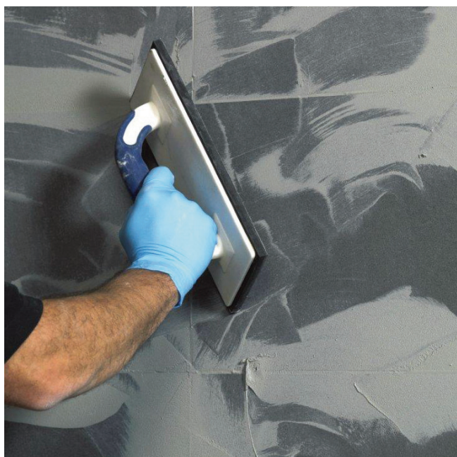
Plynulé a jednoduché spracovanie počas 40 minút...

4 Po vytvrdnutí odstrániť zvyškový maltový povlak mierne vlhkou špongiou.