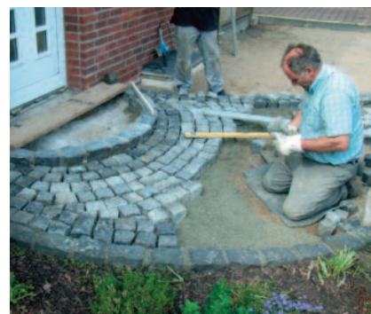
Pokladanie malých dlažbových kociek do PCI Pavifix® DM