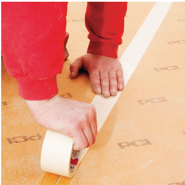
V suchých priestoroch prelepiť spoje krepovou lepiacou páskou, v priestoroch zaťažených vlhkosťou utesniť s PCI Pectape...