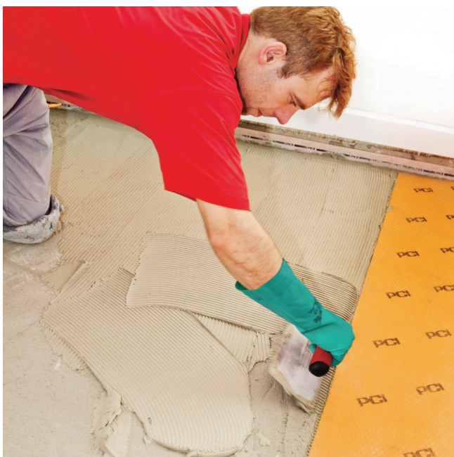
Na pripravený podklad naniesť PCI Nanflott light alebo PCI Rapidflott ...

Aby mohla byť spod PCI Pecilastic U odvádzaná zvyšková vlhkosť, nesmú sa na okrajoch utesniť ani okrajové škáry ani soklové lišty.