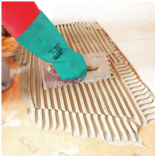
... a do PCI Nanoflott light alebo PCI Rapidflott položiť novú keramickú dlažbu.