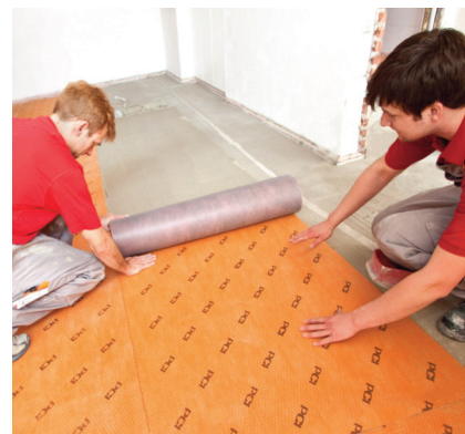
Na PCI Pecilastic U možno vďaka oddeľovacím a izolačným vlastnostiam bezpečne a funkčne lepiť keramické dlažby.