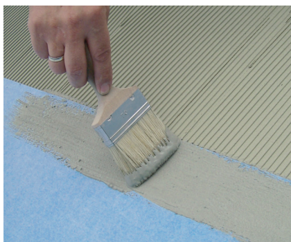
Na dokonalé zlepenie spojov na PCI Pecilastic W je treba použiť PCI Seccoral 1K/2K Rapid.

Podklad musí byť pevný, suchý (cementový poter max. 4 %, anhydritový poter 0,5 % zvyškovej vlhkosti, merané CM-prístrojom), čistý a zbavený olejov, masntôt ako aj iných zvyškov. V prípade potreby tieto bezo zvyšku odstrániť opieskovaním, kefou alebo otryskaním oceľovými guľičkami (Blastrac). Veľké rovné plochy (príp. rovnosť dosiahnuť pomocou PCI Periplan, PCI Pericret, alebo PCI Nanocret FC/R2/R3/R4) nesmú obsahovať žiadne štrkové hniezda, otvorené trhliny, alebo výčnelky. Podklady s obsahom sadry a sadrokartónové dosky penetrovať s neriedeným PCI Gisogrund. Nasiakavé minerálne podklady penetrovať s PCI Gisogrund zriedeným vodou v pomere 1 : 1. Suché, pevne držiace drevotriekové dosky penetrovať s PCI Wadian. Penetrácia musí byť pred nalepením PCI Pecilastic W vytvrdnutá.