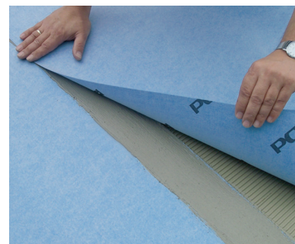
S PCI Pecilastic W môžu byť povrchy citlivé na vlhkosť zaizolované rýchlo a bezpečne.