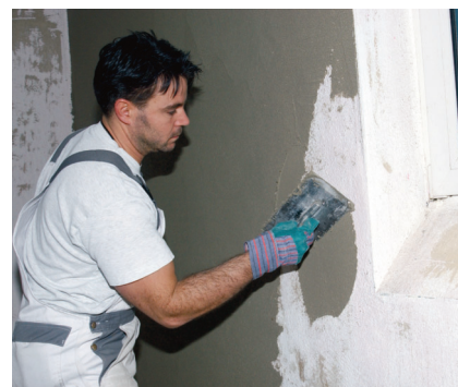
PCI Pericret sa veľmi ľahko spracováva v hrúbkach vrstvy 3 až 50 mm.