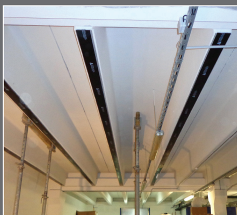
SYSTÉMY NA ZOSILOVANIE NOSNÝCH KONŠTRUKCIÍ