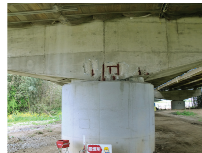
Korózia spôsobená atmosférickými vplyvmi a karbonatáciou