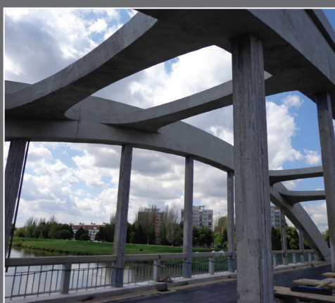
SYSTÉMY NA OPRAVU A OCHRANU BETÓNU