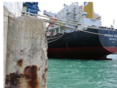
Chloridmi spôsobená korózia od posypových solí

Najčastejším dôvodom korózie ocelevej výstuže v betóne sú karbonatácia alebo vnikanie chloridov do betónu spolu s vodou. Pochopenie príčin korózie ocelevej výstuže umožňuje navrhnúť stratégiu najefektívnejšieho postupu opravy a ochrany. Produkty a systémy firmy Sika umožňujú flexibilný výber kvalitných a efektívnych riešení.